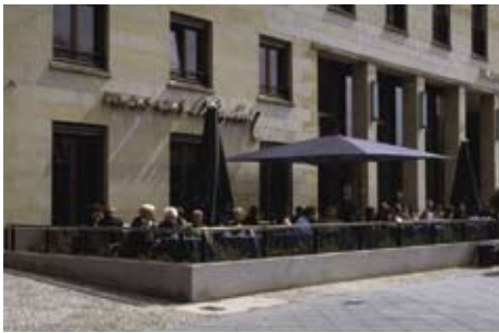
歩道幅の広い大通りに面したオープンエアのカフェ

ポツダム広場周辺にも観光客向けのカフェはたくさんありますが、地元の人たちが集っているのは旧東ベルリンの中心部。まだ肌寒さの残る4月のベルリンだったけれど、少しでも天気の良い日には長い冬の間ずっと待ち侘びた太陽を楽しむように、人々はオープンエアのカフェで時間を過ごしている様子でした。