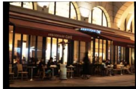
東京のオシャレなカフェ