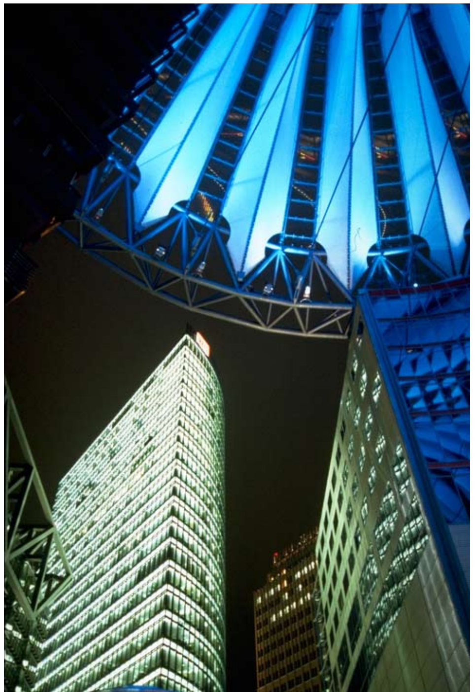
ベルリン・ポツダム広場