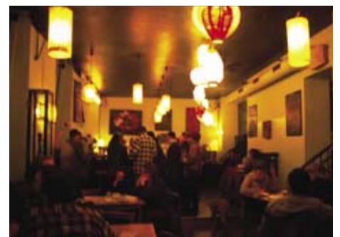
あたたかなペンダントが店内を照らす