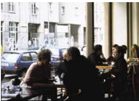
窓際の席から埋まっていく

最初に足を踏み入れたのは、イタリア人の経営するカフェ。やはりイタリア人のコーヒーはどこで飲んでもおいしい。座る場所は奥にもたくさんあるはずなのに、席は通りに面した窓際から徐々に埋まっていきます。夕暮れにはまだ少し時間のある午後のゆっくりした時間を楽しむ人たち。窓際の席に差し込むどんよりした柔らかな光は室内にあるのにオープンエアのカフェと同じ印象を与えていて、居心地のよい半屋外？半室内？どちらとも言えない空間を構成しています。店のあかりはまだ点いていません。