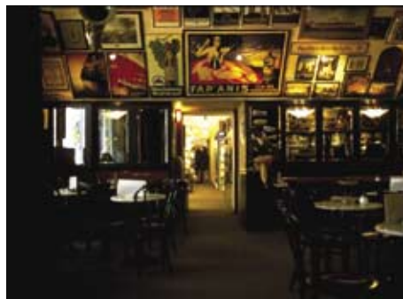
骨董屋街の通路の途中になんとカフェが・・・

ドーム状の天井には一面にアンティークの看板が埋め込まれていて、美しいアールを描いています。クラシカルなペンダントやステージライトが空間のアクセントとなり、まるでタイムスリップしたかのような黄金の空間にしばし酔いしれてしまいました。カフェだけれど骨董ストリート通路でもあるので、お茶をしていると横を人が通ります。それがとても不思議な印象。ガラスを通して差し込む曇り空の青白い光と金色のドームから構成される場所。このコントラストが何とも言えない安堵感と心地よさなのです。いつまでも飽きることなく長居したいカフェに仕上がっています。