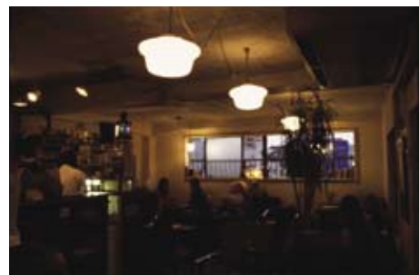
都会の一角の古いマンションで隠れ家的カフェを発見