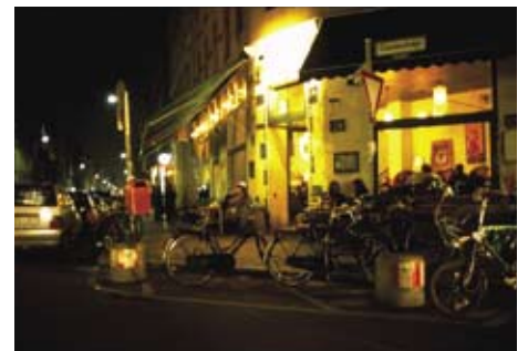
夜カフェに誘われて街へ出る

この店の自慢はオーナーのコレクションだと言うペンダントライト。フォルムもひとつひとつが特徴的で、全く統一感など出なさそうなものなのに、あたたかな白熱の調光されたあかりがこの店に見事にマッチ。店内の喧騒と相まって夜カフェの魅力を引き立てています。