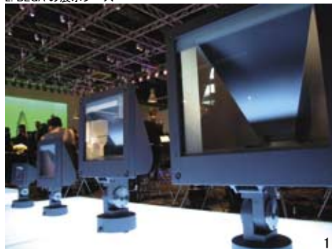
1. ERCO のアウトドアシリーズ 2. BEGA の展示ブース