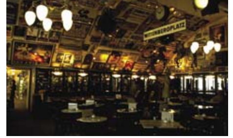
高架下のクラシカルなカフェ

夜カフェの魅力も大人文化の成熟しているヨーロッパならではの。きっと東京では見られない夜の世界がそこには広がっているのでは？！、と私たちは某雑誌の一枚の写真にまんまと誘惑されて、とあるカフェにやってきました。人がシルエットとなって闇に浮かび上がる何やら怪しげな雰囲気。うーん、これは行ってみたい！しかし、一歩足を踏み込んで拍子抜けしてしまいました。写真で見たような闇と人間