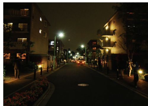
二子玉川西川住宅街：左側のマンションは低い色温度で統一されているが、道路灯の白さとの違いがアンバランスとなっている。