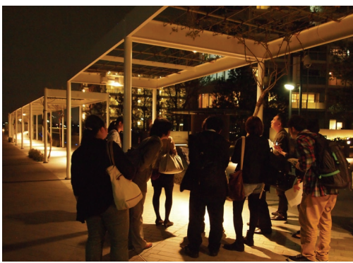
公園へとぬけるパッセージ。人通りもまばらなので、明るさだけが目立つ。