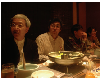
突如の雷雨にみまわれ、調査を中断。少し早めに懇親会開始。