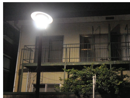
強烈なまぶしさが、住宅に光害をもたらしている。