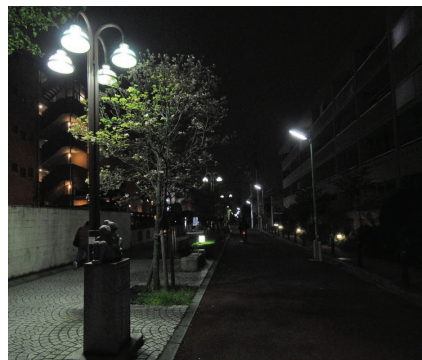
道の左右で意匠の違う街路灯が設置されている。