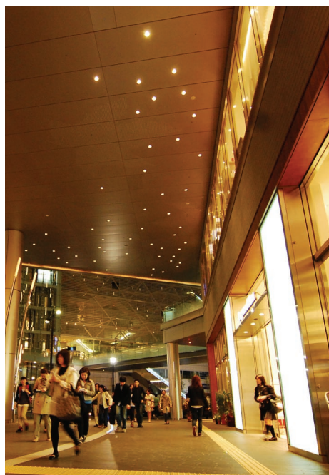
駅商業施設。店舗からのあかりで、心地よい空間となっている。