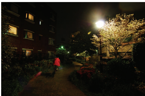
眩しいわりには、足元がそれほど明るく照らされていない。