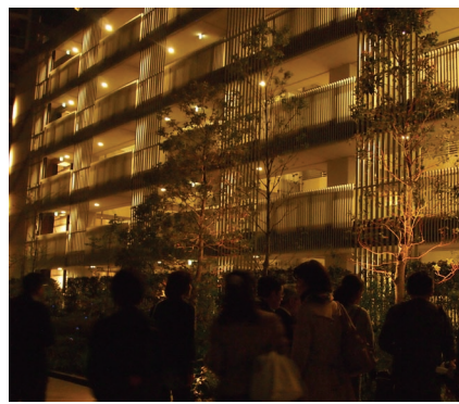
通路にはあかるすぎるのではという意見も。