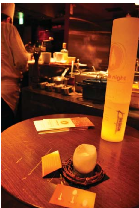
お店で販売されたチャリティーキャンドル。