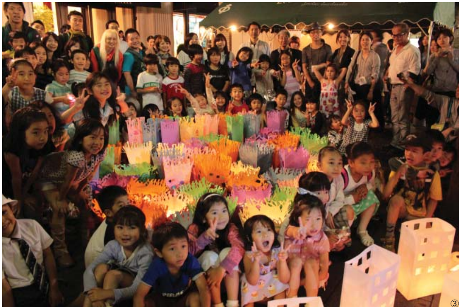
①集中して作りに挑む子ども達