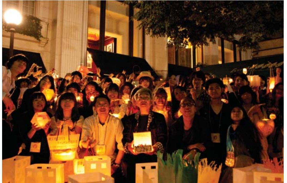
今年は総勢452名がキャンドルナイト@OMOTESANDO-Eco Avenueに参加し、表参道の街をキャンドルの明かりで彩りました。