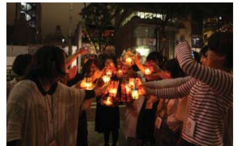
②オリジナル行灯:キャンドルを灯した個性豊かなデザイン行灯が表参道に集まりました。お気に入りの行灯を見つけましたでしょうか？