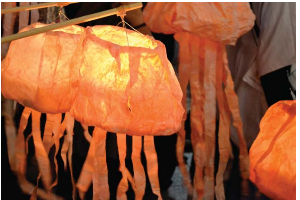
クラゲの形をした行灯。長い棒の先でクラゲが泳いでいました。