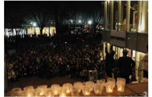
①モチーフの下からキャンドルで照らすと言葉がゆらゆらと影になって現れます。