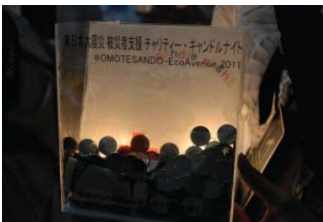
復興の灯火を思わせる明かりの募金箱。中のお金が立ち上がるようにしてお金のシルエットが見えるようにしています。