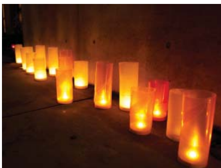
キャンドルの暖かなあかりが窓にも映り込み、そして、奥へと誘い込むような魅力的なあかり。