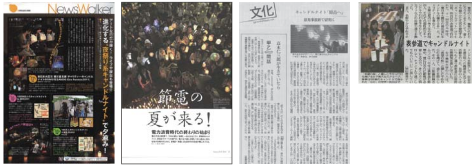
キャンドルナイトイベント前後に掲載された記事