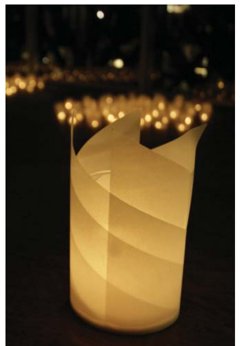
紙を通したやわらかなあかりで演出。