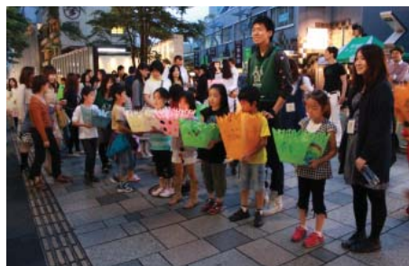
③子供たちのキャンドルパレード:神宮前小学校の子供たちが気持ちを込めて作った行灯を持って、表参道をパレードしました。