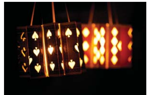
トランプの模様からこぼれる灯が綺麗です。