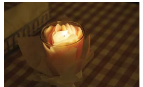
④キャンドルカフェネットワーク:表参道周辺の参加カフェが美大生とコラボ、キャンドルを灯して営業しました。いつもとは少しだけ表情が違って、ゆったりとした時間を過ごす提案をしました。