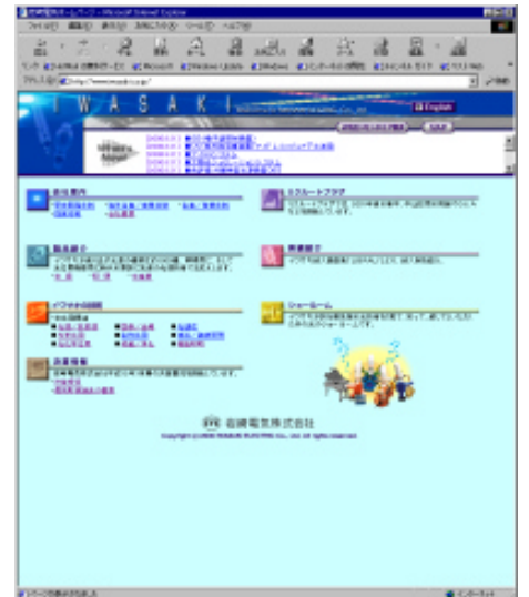
岩崎電気株式会社ホームページ