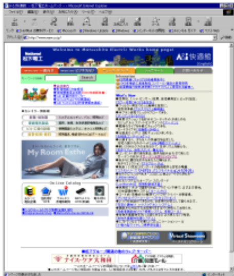
松下電工株式会社ホームページ