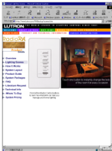
調光機のボタンを押すとシーンが変わる