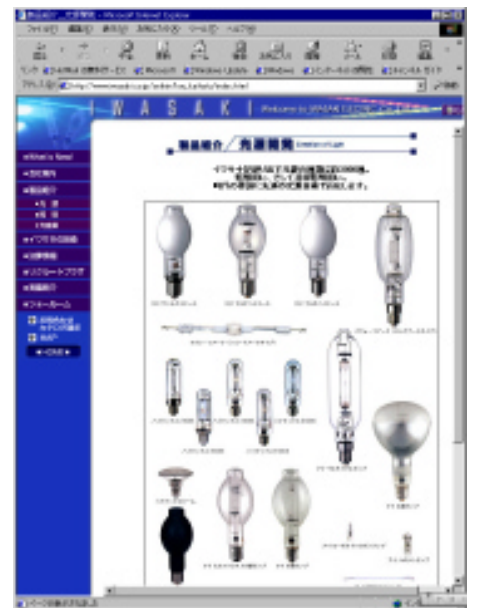
製品がわかりやすいレイアウト