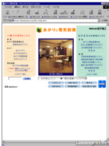
あかりと電気設備のページ 情報が満載

小泉産業株式会社 http://www.koizumi.co.jp/ 株式会社遠藤照明 http://www.endo-lighting.co.jp/ 三菱電機照明株式会社 http://www.lsg.melco.co.jp/mlf/ 大光電機株式会社 http://www.lighting-daiko.co.jp/