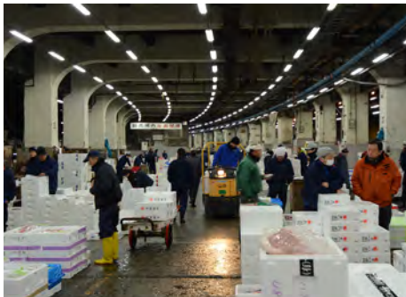
積まれた箱の間を縫うようにターレットトラックが走り回る