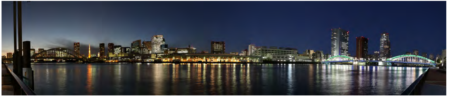
隅田川を隔てた築地対岸からの夜景。正面には築地市場、左側には東京タワーと築地大橋、右側には勝鬨橋が一望できる

昨年「市場移転問題」として話題になっていた築地市場が豊洲に移転する事が決定した。築地市場は日本・世界最大の卸売市場で人気の観光地でもある。人々を魅了するこの有名な市場には、果たしてどんな光環境が広がっているのだろうか。また、市場の為の特異な光があるのが探るべく、普段立ち入ることの出来ないせり場といったプロの取引の現場にも踏み込んで調査を行った。