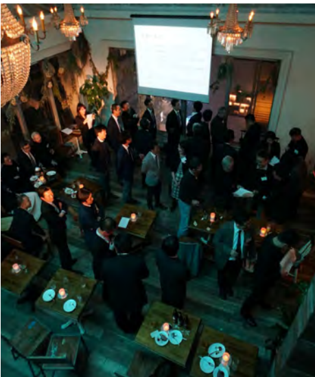
報告会会場の様子