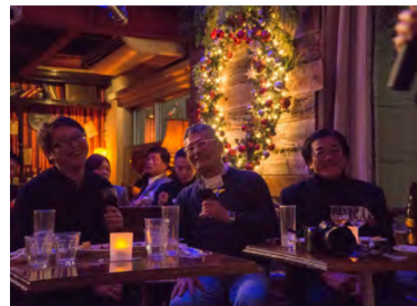
活動報告に耳を傾ける