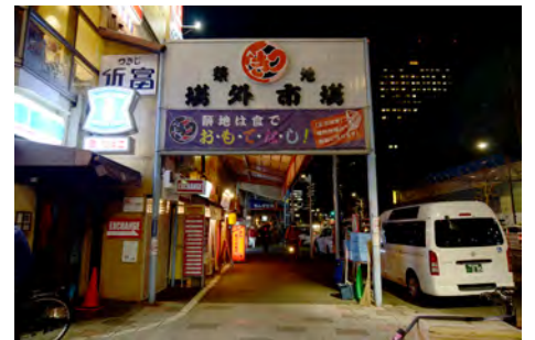
築地四丁目交差点から、場外市場の玄関口「もんげき通り」を見る