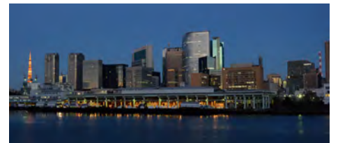
早朝の築地市場は既に活動している様子が伺える

この美しい隅田川の夜景は、これからどのように変化していくのだろうか。川の近郊では、