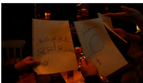
お題を絵で伝えていく伝言ゲーム ユニークな絵に会場大盛り上がり