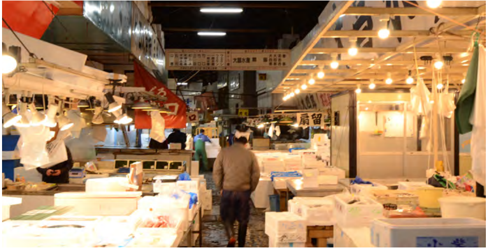
卸売業者売場の照明は業者によって異なり多種多様だった

日中にセリ場と仲卸売場の間の通路を歩いたことがある。そこには勾配の付いたポリカ波板の屋根がかかっている。屋根には無数の小さな穴が空いており、築地市場が老朽化している部分も同えた。そこから差し込む太陽の直射光が偶然にも木漏れ日のような美しい光の表情を冬のアスファルトに落とし込んでいた。春の日差しを思わせる、やわらかな光の輪郭が重なり合いながら連なる道。光環境として特筆すべきことでは無いのかもしれないが、時間の経過と光が織りなす詩的な光景が築地にあったという事実を書き留めておきたい。