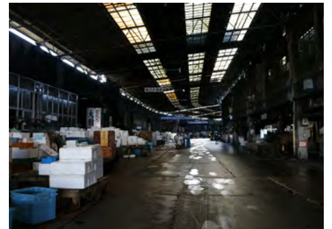
セリ場と仲卸売場の通路