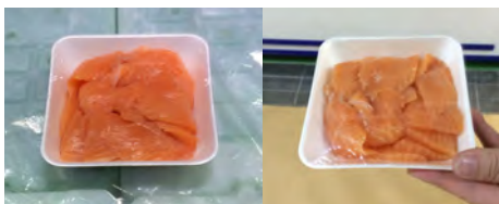
左側は売場で撮影したのに対して、右側は通路で撮影した。