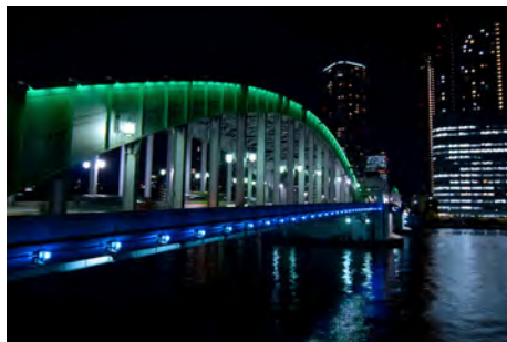
ライトアップされた勝鬨橋