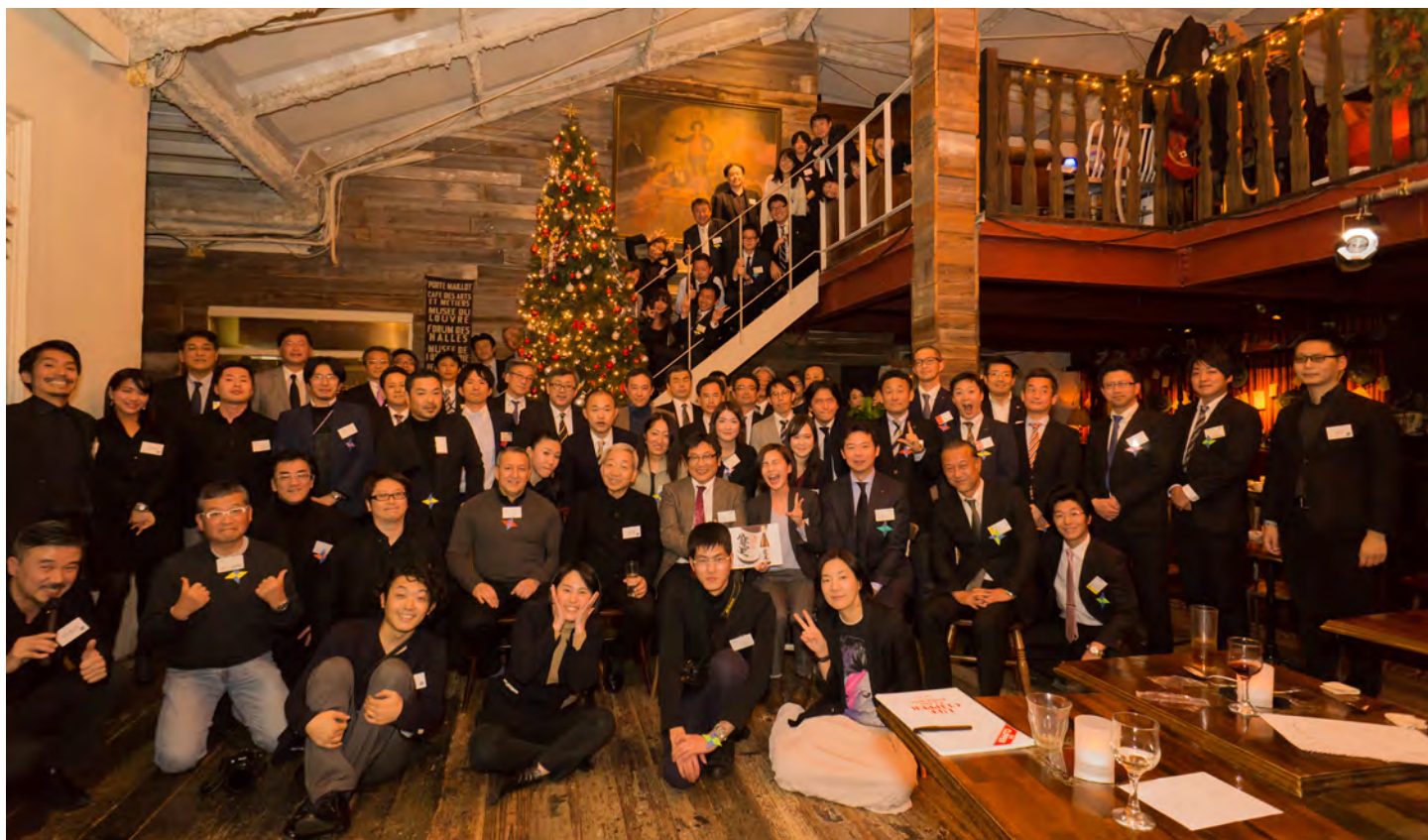
参加者全員での集合写真。皆様のご支援に心より感謝申し上げます!!

年末恒例になっている探偵団年間活動報告会を開催。2017年に開催した様々なイベントが第員から報告されました。日ごろ活動に参加できない方々にもその内容を知っていただく機会になり、団員同士の親睦も深めることができました。