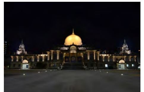
ライトアップされた築地本願寺